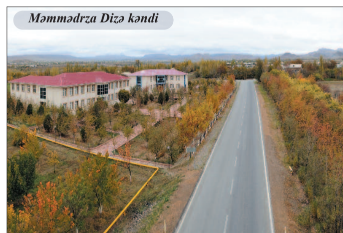
Məmmədrza Dizə kəndi

Ötən iyirmi il ərzində Babəkə mədəniyyətin inkişafı istiqamətində də mühüm tədbirlər həyata keçirilmişdir. Bu dövrdə rayonda 22 mədəniyyət müəssisəsi üçün yeni binalar istifadəyə verilmişdir. Hazırda rayonda fəaliyyət göstərən 1 mərkəzləşdirilmiş kitabxana sistemi, 37 kənd filial kitabxanası, 17 mədəniyyət evi, 13 klub, 2 muzey, 5 uşaq musiqi məktəbi, 1 xalq teatrı insanların sosial-mədəni tələbatlarının ödənilməsinə, asudə vaxtın səmərəli təşkilində mühüm rol oynayır. Rayonun mədəniyyət müəssisələrində fəaliyyət göstərən 6 nəfər Əməkdar artist və Əməkdar mədəniyyət işçisi onlara göstərilmiş yüksək qayğı öz səmərəli fəaliyyəti ilə doğrultmağa çalışırlar.